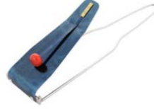
ocarina's kalimba, dondertrommel, ocean drum, chimes, flexa-tone.