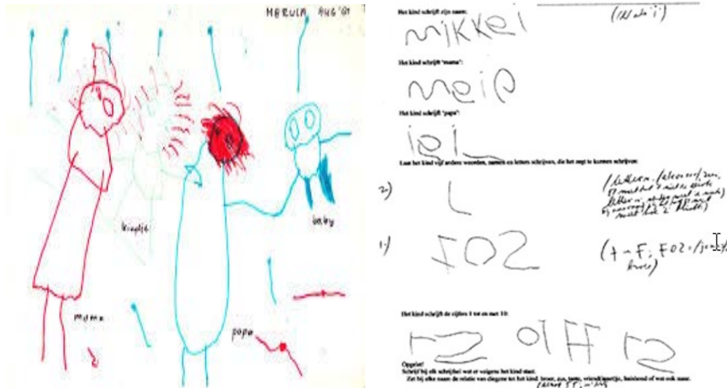
Fig. 1. Hoe jonge kinderen tekenen en schrijven